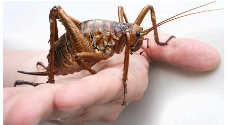
He wētā punga. Ehara nā T.O.I ēnei pikitia