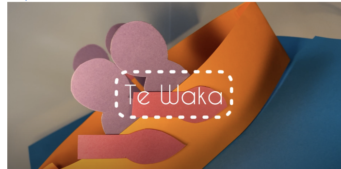
Puka Pāpapa Pepeha #1 - Te Waka Whakaaraara