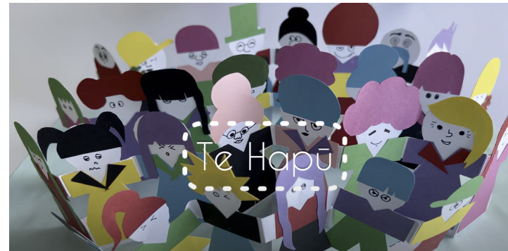
Puka Pāpapa Pepeha #5 - Te Hapū Whakaaraara